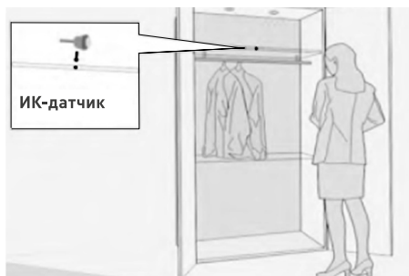
Вариант установки SR2-Door